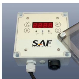
Elektronischer Temperaturregler Serie KM-EC1000

Zur Temperaturregelung empfehlen wir unser Programm an elektronischen Steuer- und Temperaturregelgeräten sowie die entsprechenden Temperaturfühler.