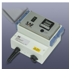
Elektronischer Temperaturregler Serie KM-RD1000