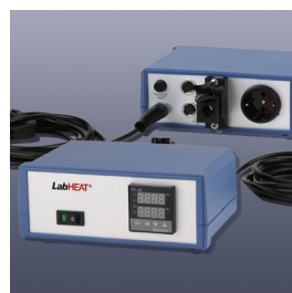
Elektronischer Laborregler Serie KM-RX1000