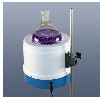
Type KM-SK mit KM-SS

SAF Wärmetechnik GmbH Weinheimer Str. 2a D-69509 Mörlenbach